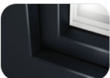
szary antracytowy (struktura piaskowa)