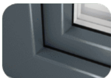
bazaltowy szary (struktura piaskowa)