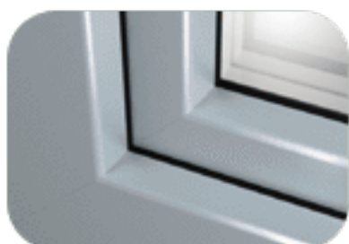
szary (struktura piaskowa)