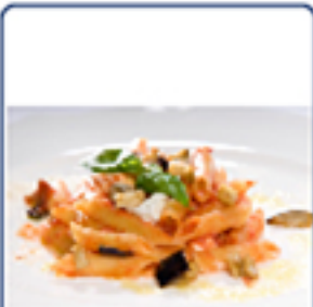
Penne alla norma