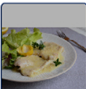
Scaloppine al limone