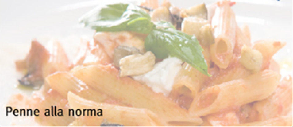
Penne alla norma

Plate symbol of Italy, of eating well with quality ingredients and related to the tradition of the Roman territories.