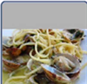
Spaghetti alle vongole