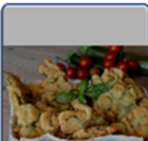
Frittini di zucchine